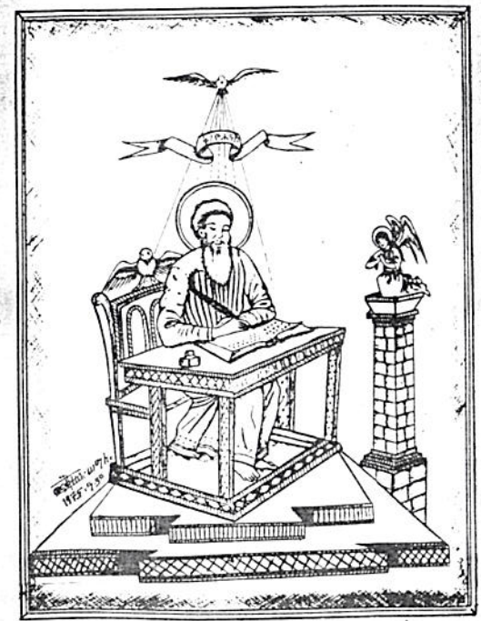
ወንጌላዊው ቅዱስ ዮሐንስ