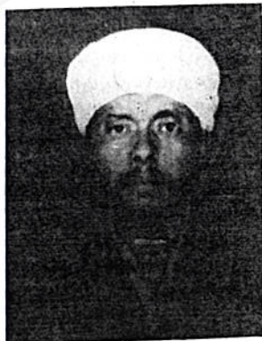
መጋቢ ልዑካን በቀለ አንበሳው እኒህ ናቸው

ከዚህ በበለጠ ያደረጉት ከፈትኛ ስጦታ በሕይወት ሥጋ ሳሉ በእጃቸው የጨበጡትን፣ በእግራቸው የረገጡትን ንብረታቸውንና ፆደጃፍ ክፍል ቤት በግምት ከብር 50,000 በላይ የሆነው ማለትም የቤት ቁሳቁስ ጭምር እንድም ሳይቀር ከላይ ለተጠቀሱት ለሁለቱም አድባራት አብያተ ክርስቲያን በንስሐ አባታቸው በመጋቢ